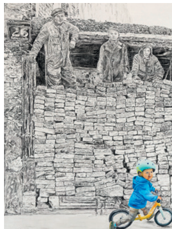
„Glaube, Liebe, Hoffnung“ (Ausschnitte), 2023, Pastell und Öl auf Holz, je ca. 105 x 150 cm