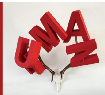
„Human als Trophäe“, 2014, Styropor auf Hirschgeweih, ca. 150 cm

Im Anschluss Rundgang durch die Ausstellung mit dem Künstlerpaar